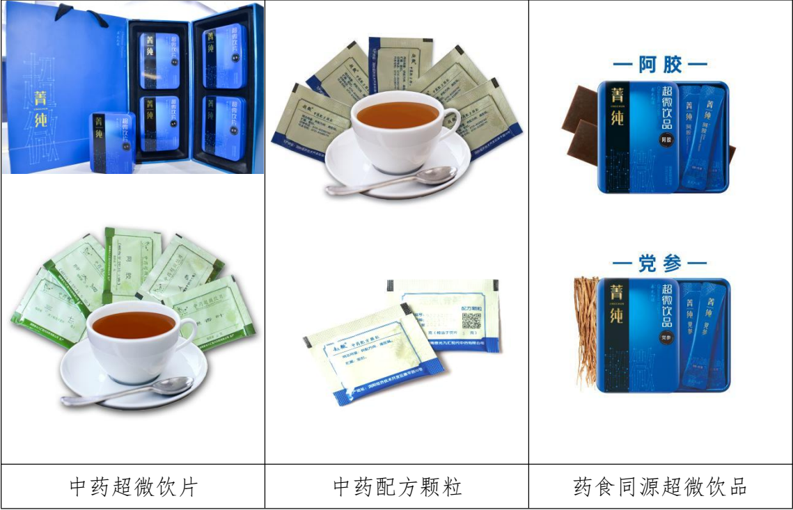
图 2 公司主要产品和品牌展示

公司“春光九汇”、“超微”、“菁纯”等品牌以品质优良而享誉全国，其中“春光九汇”、“超微”被认定为湖南省知名商标品牌，公司产品被广泛用于各级医疗机构、保健机构、食品企业等，中药超微饮片和中药配方颗粒等产品具有质量可控、高效免煎、节省药材、方便卫生、便于配伍等特点，得到了广大用户的一致好评和高度信赖。