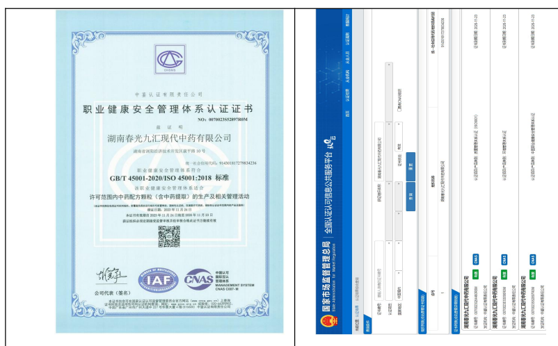
图 4 职业健康安全管理体系证书

2023 年 11 月 24 日，公司获得中鉴认证有限责任公司颁发的最新 GB/T 45001-2020/ISO 45001:2018 职业健康安全管理体系认证证书（证书编号：0070023S52897R0M），有效期至 2026 年 11 月 23 日。