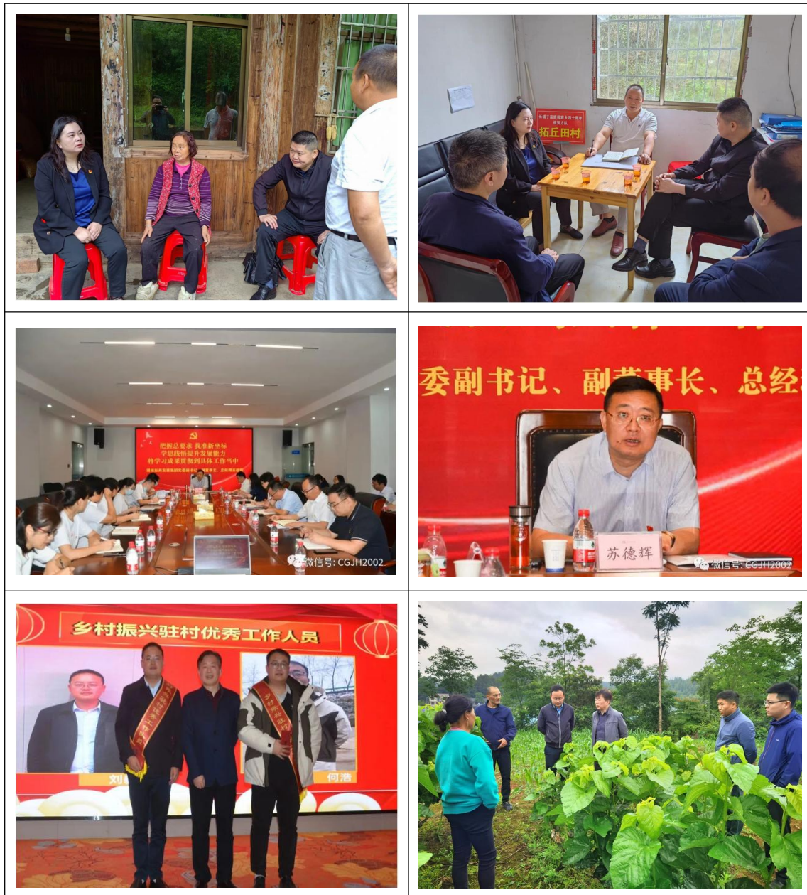
图 3 主要社会责任大事现场照片